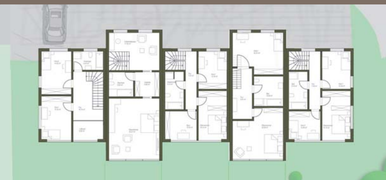
Beispiel Grundriss Obergeschoss