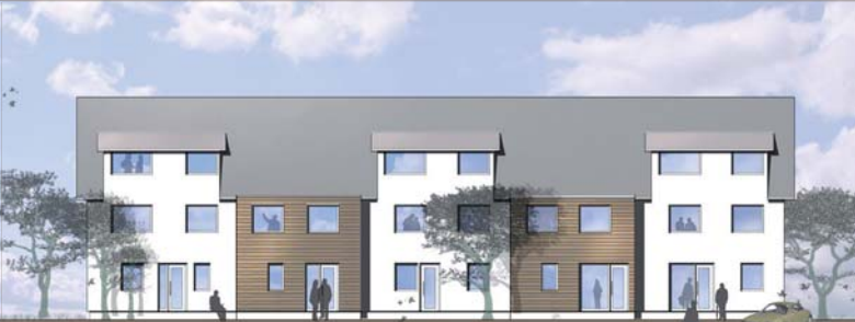
Beispiel Ansicht Nord