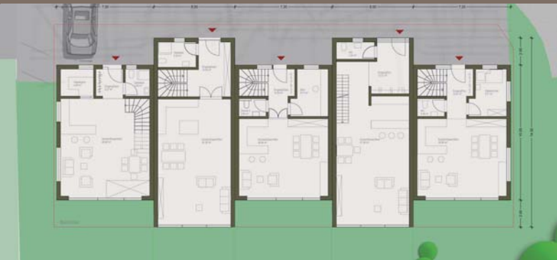
Beispiel Grundriss Erdgeschoss