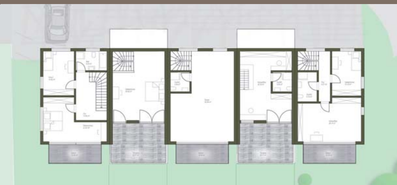
Beispiel Grundriss Dachgeschoss