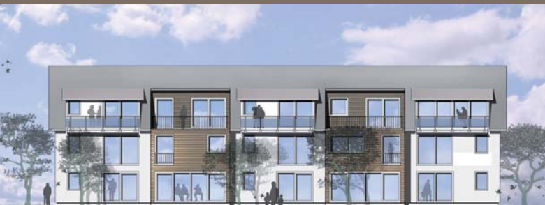
Beispiel Ansicht Süd

Die Grundrisse der Reihenhäuser können zum Wohnen und Arbeiten oder familienfreundlich als Mehrgenerationenhaus entworfen werden. Ein Ausbauhaus mit Einweisungen und Beratungen in allen Bereichen ist genauso möglich wie das schlüsselfertige Reihenhäuser.